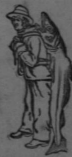
Sea esta Marca Registrada Legítima

NO CONTIENE ALCOHOL, GUAYACOL, CREOSOTA NI NINGUNA SUBSTANCIA NO-CIVA O IRRITANTE.